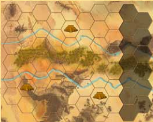
Assyria à 3 joueurs