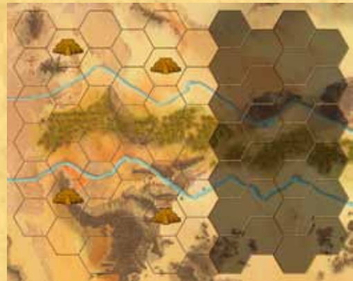
Assyria à 2 joueurs