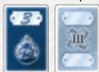
10 cartes Porcelaine de départ