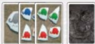
30 cartes Eléphant