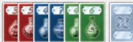
40 cartes Porcelaine en rouge, bleu, et vert