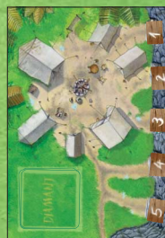
Illustration 2 : situation au début de la partie