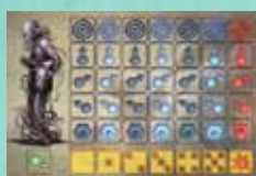
6 tableaux de bord