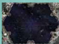
1 plateau de jeu