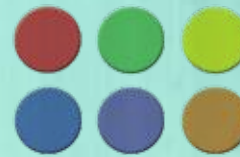
48 jetons transparents