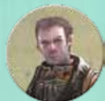
6 jetons Pilote