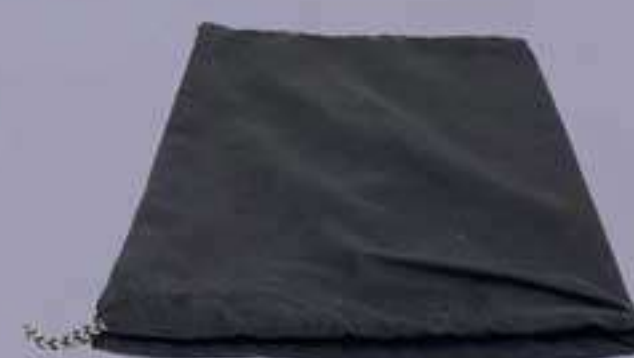
1 sac en tissu