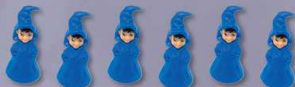
6 Figurines Apprenti