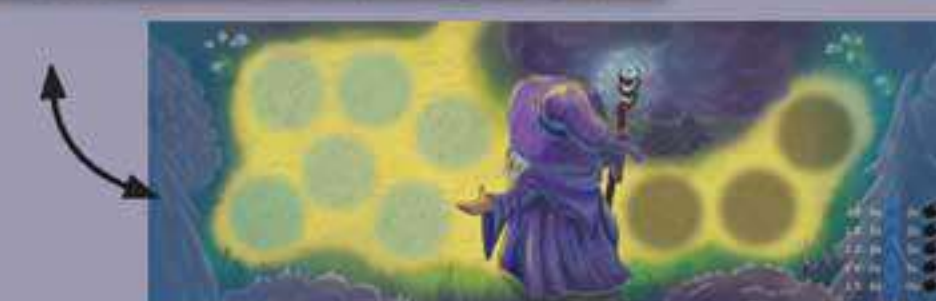
1 Plateau Arrivée Élias recto-verso