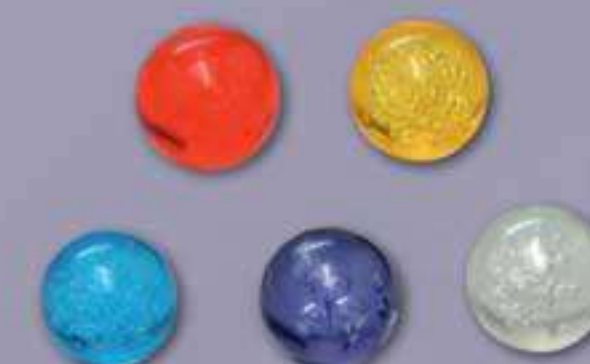
5 Feux follets (billes) : rouge, jaune, violet, bleu et blanc