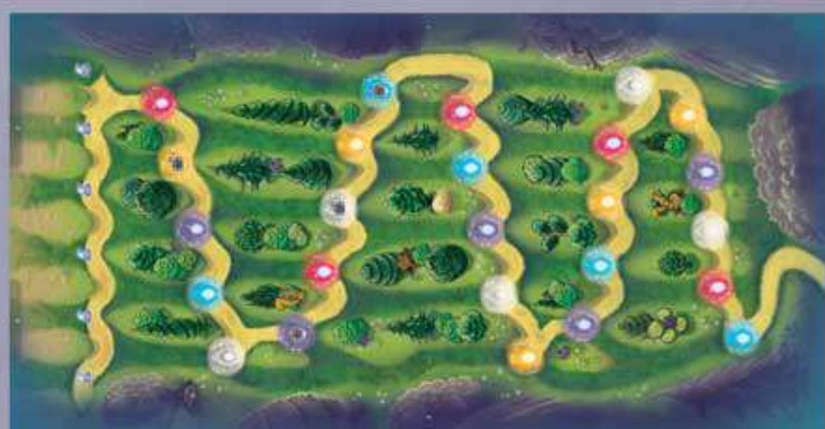
1 Plateau de jeu avec 4 supports (n°1, 2 et 3)