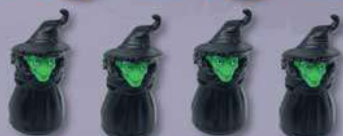
4 Figurines Sorcière