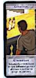
2 cartes Courtisan