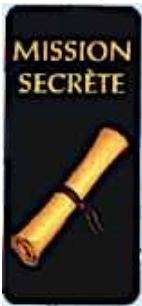
Dos des cartes mission secrète