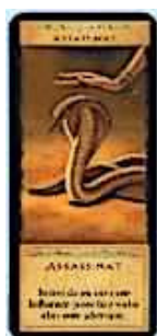
4 cartes Assassinat