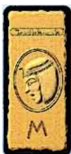
Dos des 13 cartes de manipulation Égyptienne