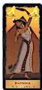
7 cartes Danseuse