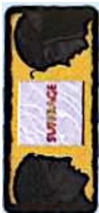
Dos des cartes Suffrage

Si vous contrôlez au moins 3 Sénateurs, vous gagnerez un bonus de 2 points de victoire en fin de partie.