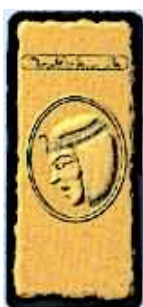
Dos des 37 cartes d'influence Égyptienne

50 cartes Égyptiennes (37 cartes influences et 13 cartes manipulations)