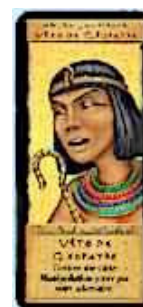
2 cartes Veto

50 cartes Romaines (37 cartes influences et 13 cartes manipulations)