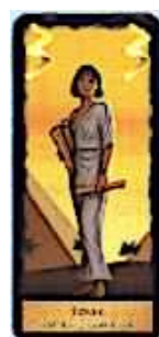
7 cartes Scribe