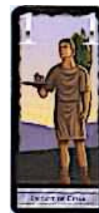
7 cartes Esclave