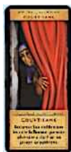
2 cartes Courtisane