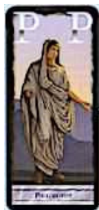
2 cartes Philosophie