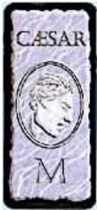
Dos des 13 cartes de manipulation Romaine