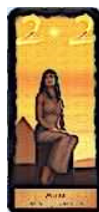
7 cartes Muse