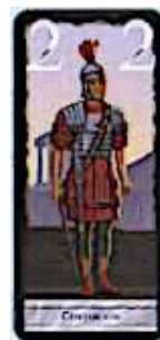
7 cartes Centurion