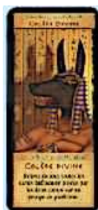
1 carte Colère Divine