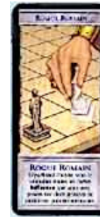
2 cartes Roque Romain