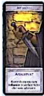
4 cartes Assassinat