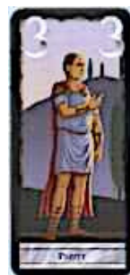
7 cartes Préfet