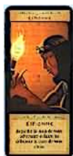
2 cartes Espionne