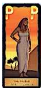
2 cartes philosophie