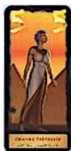
7 cartes Grande prêtresse