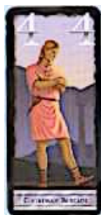
7 cartes Courtisan