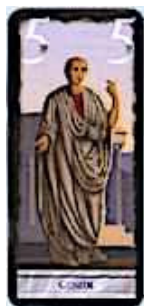
7 cartes Consul