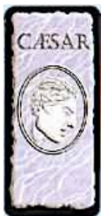
Dos des 37 cartes d'influence Romaine

50 cartes Romaines (37 cartes influences et 13 cartes manipulations)