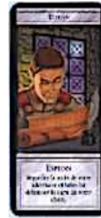
2 cartes Espion