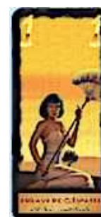
7 cartes Esclave