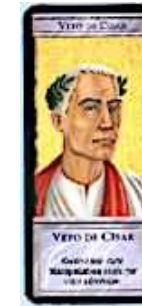
2 cartes Veto