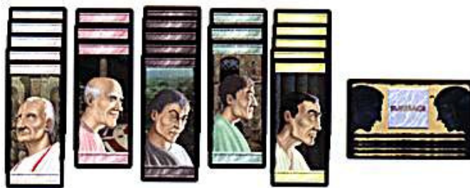
Constitution du forum

Mélangez les 8 cartes "Suffrage" et placez les faces cachées à côté des cartes "Patricien"