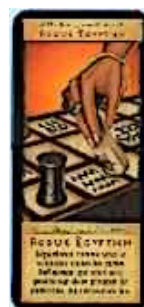
2 cartes Roque Égyptien