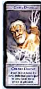
1 carte Colère Divine